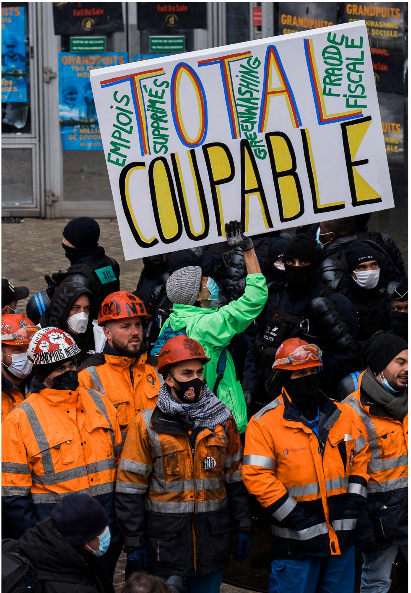
Manifestants devant le siège de Total à la Défense le 9 février 2021 pour protester contre la reconversion de la raffinerie du groupe de Grandpuits (Seine-et-Marne)