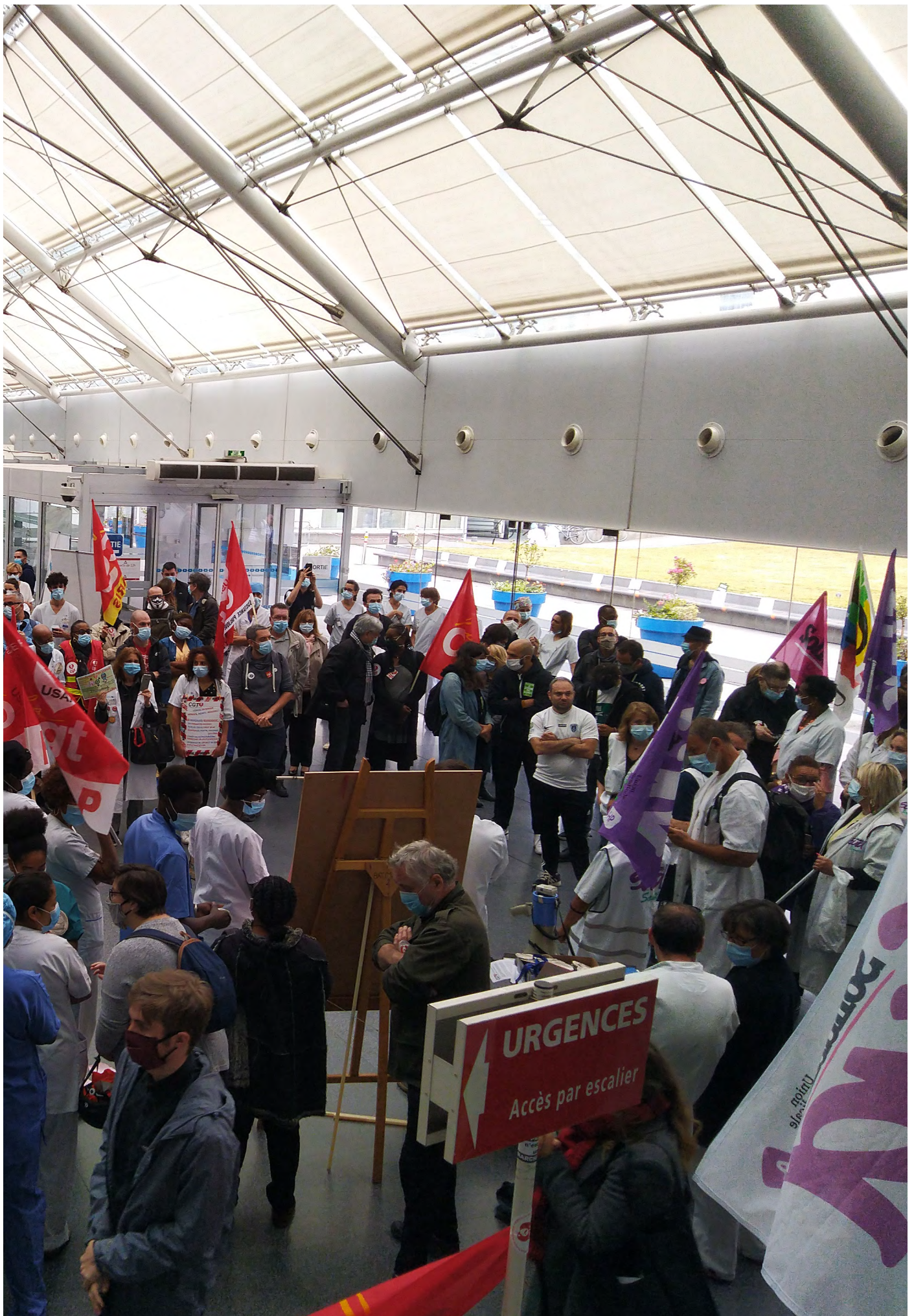
Soutien aux mobilisations des soignant-es par le collectif « Plus jamais ça » en juin 2020.