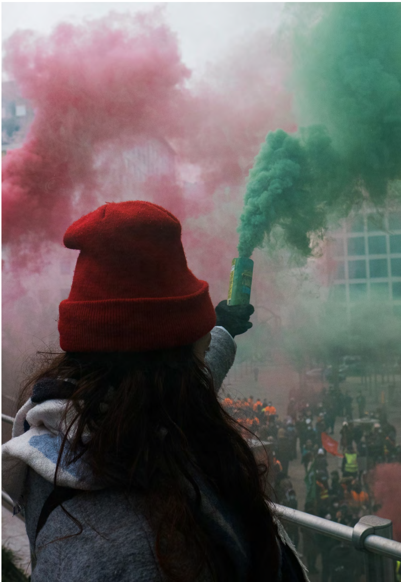
Manifestants devant le siège de Total à la Défense le 9 février 2021 pour protester contre la reconversion de la raffinerie du groupe de Grandpuits (Seine-et-Marne)